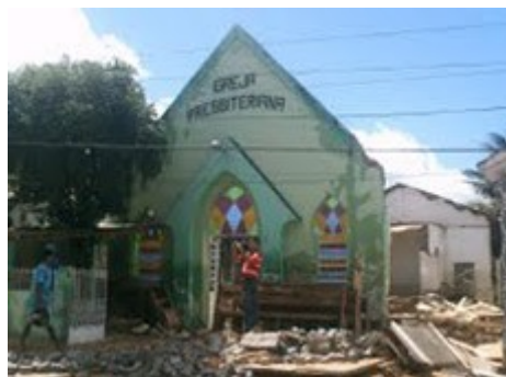
IPB de Palmares.