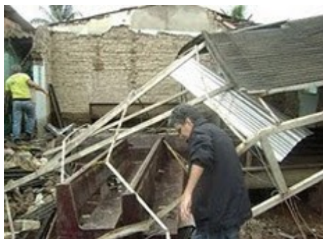
IPB de Palmares.

Conclamamos a todos os jovens que façamos nosso papel diante dessa situação. Nós jovens presbiterianos é hora de mais uma vez mostrarmos que “Sou Testemunha” abraçando as necessidades de um irmão, mesmo estando este distante.